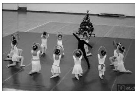
Natal CNG 2013

Os nossos agradecimentos a todos que nos acompanham e colaboram nas aulas e nos eventos de nossa iniciativa. Um grande obrigado ao CNG pelo apoio que nos dá todo o ano e à CMC por continuar a estar presente e participativa na nossa caminhada. Um bom ano de 2014 com muito sucesso a nível profissional e pessoal.