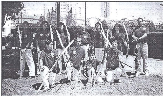
Presença dos Arqueiros no Festival Gimnico

Mais uma vez fizeram parte das modalidades que incorporaram o Festival Gimnico do 51º. Aniversário do CNG, tendo sido bastante aplaudidos pela assistência.