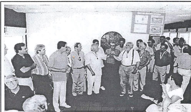
Almoço comemorativo: Encontro de amigos e de gerações

Porém, foi impossível elaborar uma lista completa dos sócios fundadores pelo que apresentamos desde já o nosso pedido de desculpas por alguma falha que resulta exclusivamente dessa falta de informação.