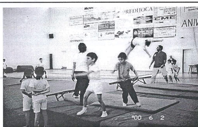
Festival Gímnico: Exibição de Classes de Ginástica

Juventude, alegria e beleza uniram-se neste espectáculo diversificado com que anualmente os nossos atletas nos brindam. E no final o agradecimento da Direcção a esses atletas, a quem foi distribuída a medalha comemorativa dos 50 anos.