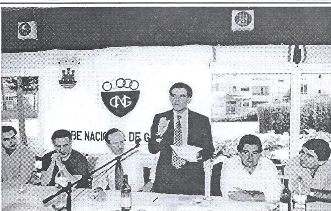
Almoço comemorativo: O Presidente do Clube no uso da palavra

Usaram da palavra, para além das entidades oficiais, que souberam dirigir ao Clube palavras de apreço pelo trabalho efectuado e incentivo para tarefas futuras, o Presidente da Mesa da Assembleia e o Presidente da Direcção, que fez um balanço da actividade realizada e expôs aos associados presentes os projectos de futuro.