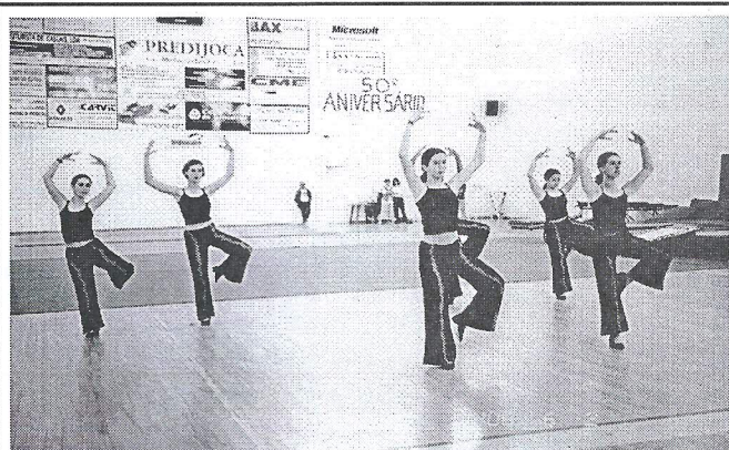
Festival Gímnico: Exibição de Classes de Ginástica

Usaram da palavra, para além das entidades oficiais, que souberam dirigir ao Clube palavras de apreço pelo trabalho efectuado e incentivo para tarefas futuras, o Presidente da Mesa da Assembleia e o Presidente da Direcção, que fez um balanço da actividade realizada e expôs aos associados presentes os projectos de futuro.