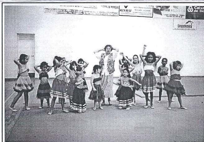
Festival Gímnico: alegria, cor e graciosidade

Integrado nas festividades comemorativas do 50.º Aniversário, realizou-se o anual Festival Gímnico, bastante participado, em que foram apresentadas as diversas classes que representam o Clube e cuja performance é bem demonstrativa da dinâmica do nosso Clube.