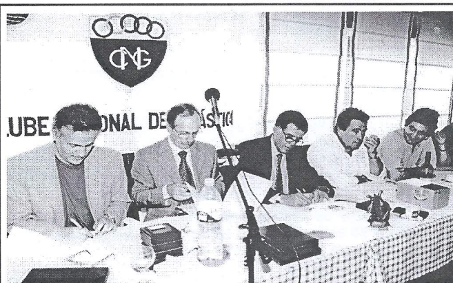
Almoço comemorativo: Assinatura do Protocolo com a C.M.C. para o financiamento da construção da piscina

É o passo decisivo para o arranque: por isso lhe chamamos o protocolo da esperança.