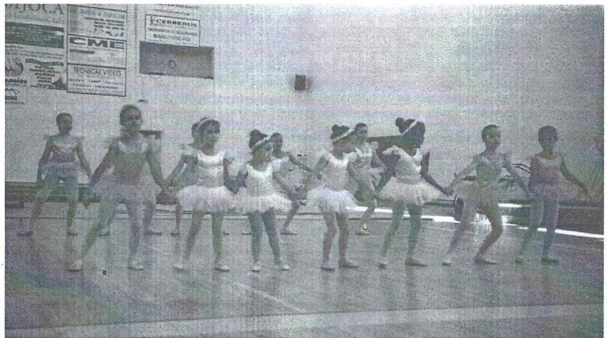
Actuação de uma das Classes de Ballet durante o Festival de Encerramento das Actividades Gímnicas do ano de 1998/99