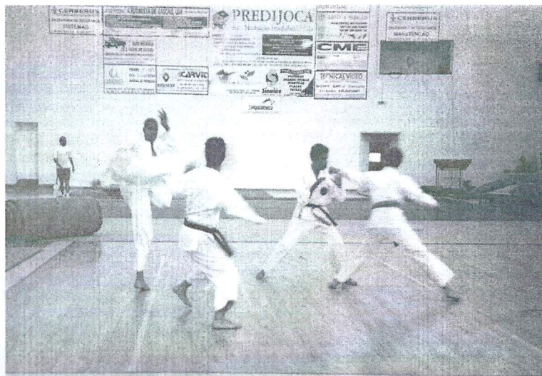
Festival de Encerramento. Classe de Karaté

No final foram distribuídas medalhas comemorativas do 49º. Aniversário do Clube a todos os ginastas participantes.