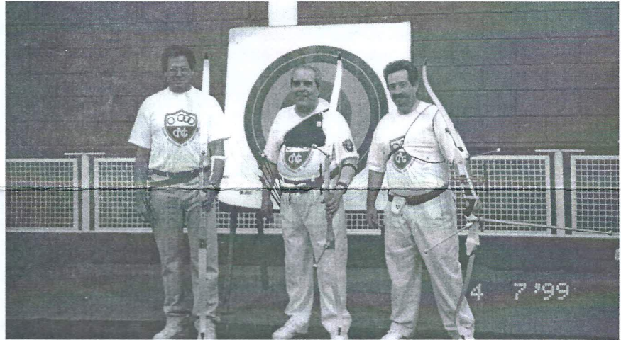
Equipa de Tiro com Arco do C.N.G.

Presentemente estamos com aulas às 2ªs e 6ªs feiras das 21:00h às 22:15h.