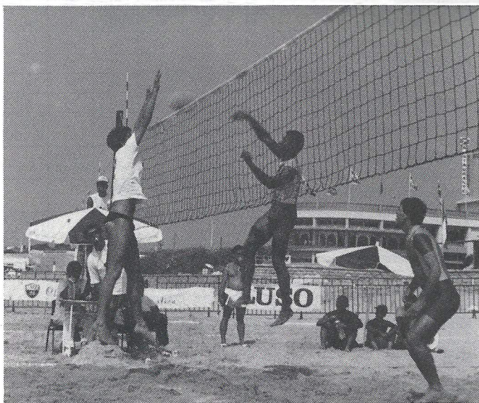
Praia Volei/TLP 90

Após o almoço foi oferecido a todos os participantes uma medalha alusiva ao acontecimento.