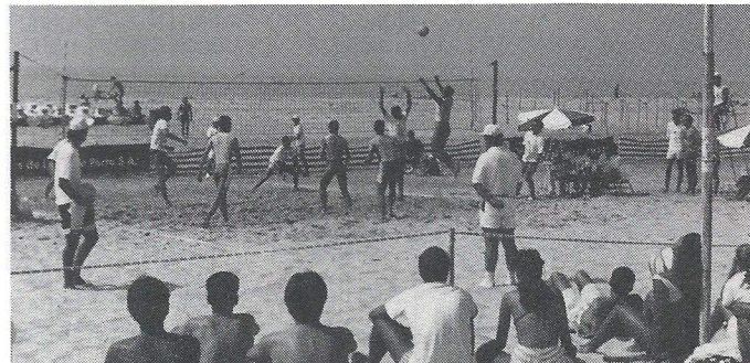
Praia Volei 90

A nível local também o nosso agradecimento ao Município de Cascais que há 4 anos nos vem apoiando na promoção do voleibol.