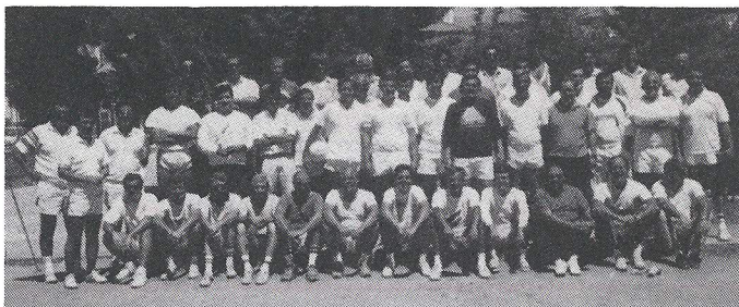
Alguns dos ex-voleibolistas do CNG - 1JUL90

Organizamos no passado dia 1 de Julho o 1.º Encontro da velha guarda do voleibol do CNG, para comemorar os 40 anos de actividade voleibolística do clube.