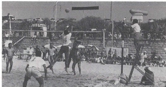
Praia Volei/TLP 90

A utilização dos espaços de treinos teve uma ocupação diária de 30 jovens praticantes.