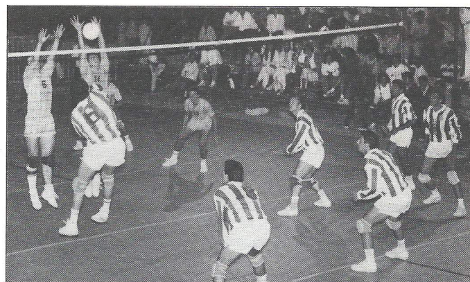
Um aspecto do Cascais Vólei 90

C.N.G. obteve o 1.º lugar e ficou apurado para a série dos primeiros.