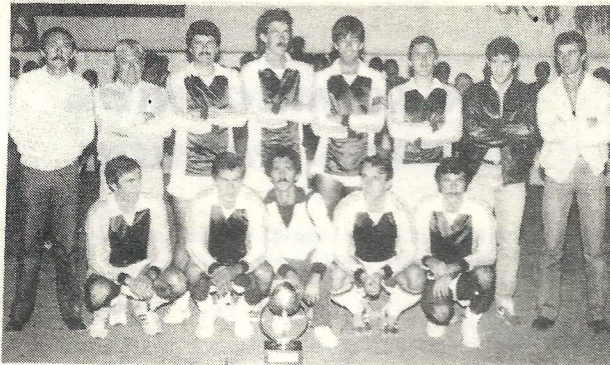
Em Cima - Equipa do BELOMAR Vencedora do Torneio do C.N.G.. Em Baixo - Equipa da PESQUISA ( químicos ) um dos nossos colaboradores com espaços publicitários e que se classificou em 2º lugar.

RUA 31 DE JANEIRO N.º5 PAREDE - (COSTA DO ESTORIL)